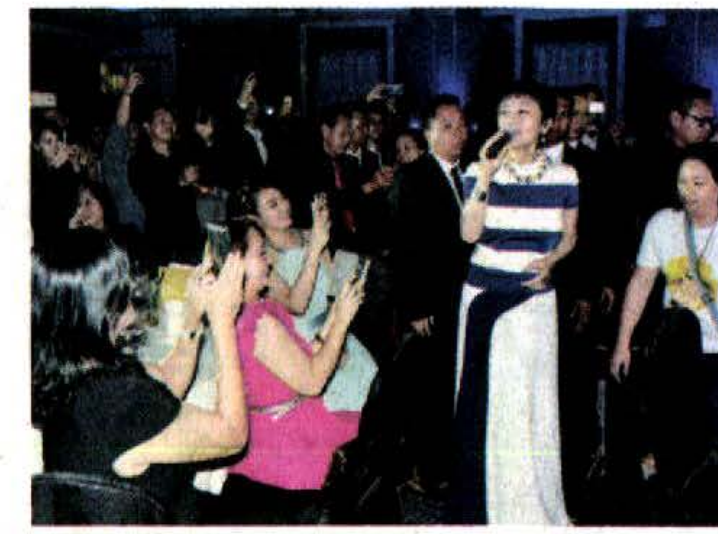
▲张艾嘉难得献唱,还边唱边与观众互动,引起大家争相拍照。