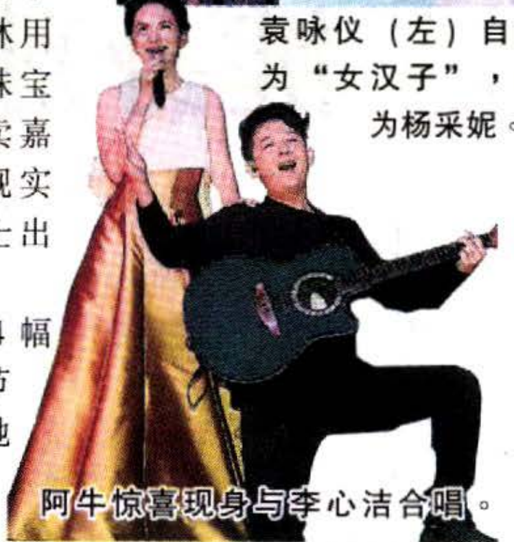
阿牛惊喜现身与李心洁合唱。