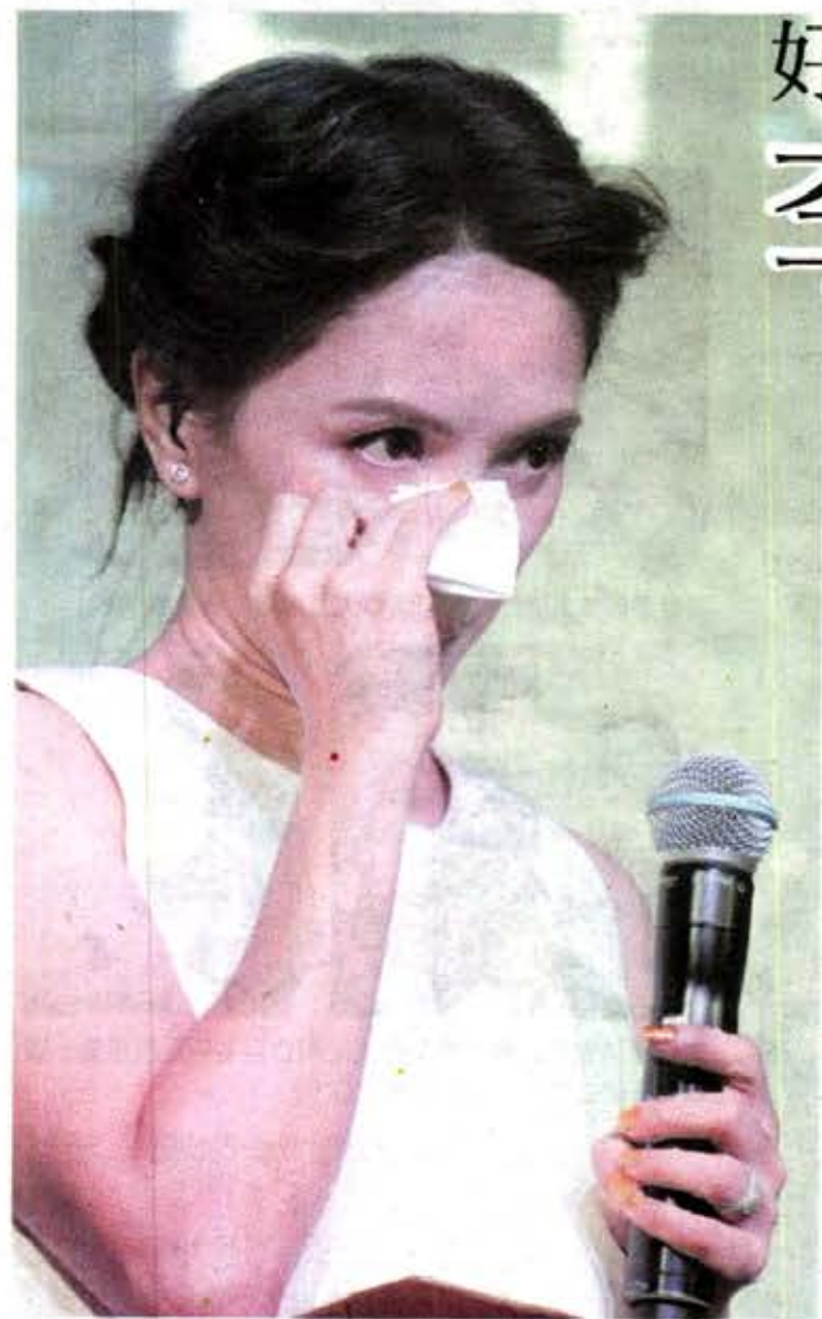
李心洁谈到基金会成立是受到外婆无私付出而启发时，忍不住落泪。