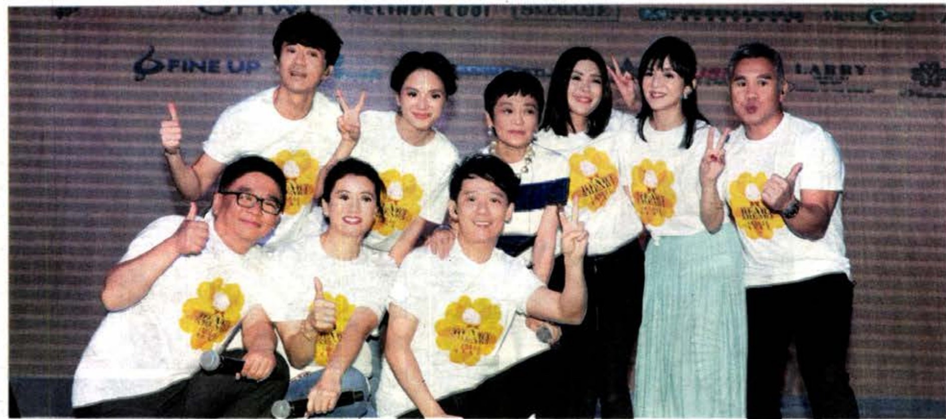
光良(后排左起)、李心洁、张艾嘉、许茹芸、杨采妮、主持人KK、主持人林忠彪(前排左起)、袁咏仪和阿牛为《小黄花心连心慈善晚宴》献技献艺，齐心为基金会筹得百万善款。