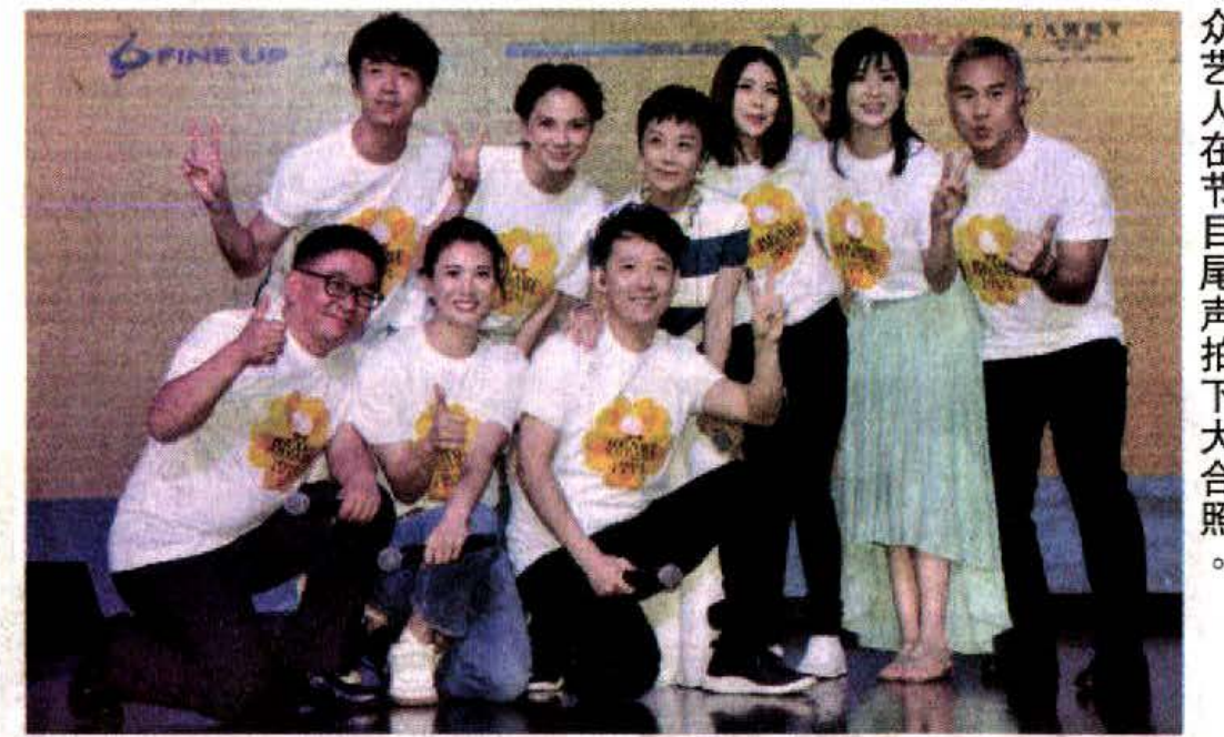
众艺人在节目尾声拍下大合照。